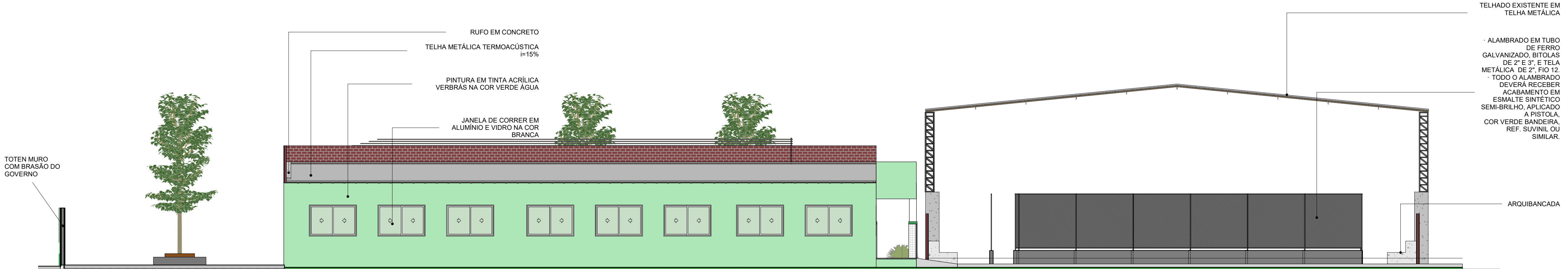
FACHADA LATERAL DIREITA ESC: 1 : 100